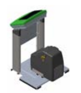
RS 90/1 nebenstehend