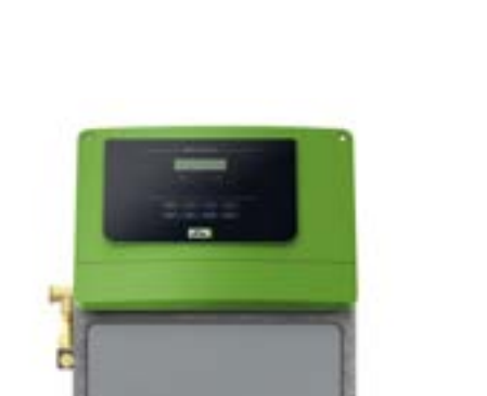
Fillcontrol Auto Compact