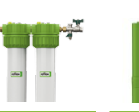
Fillsoft II Gehäuse