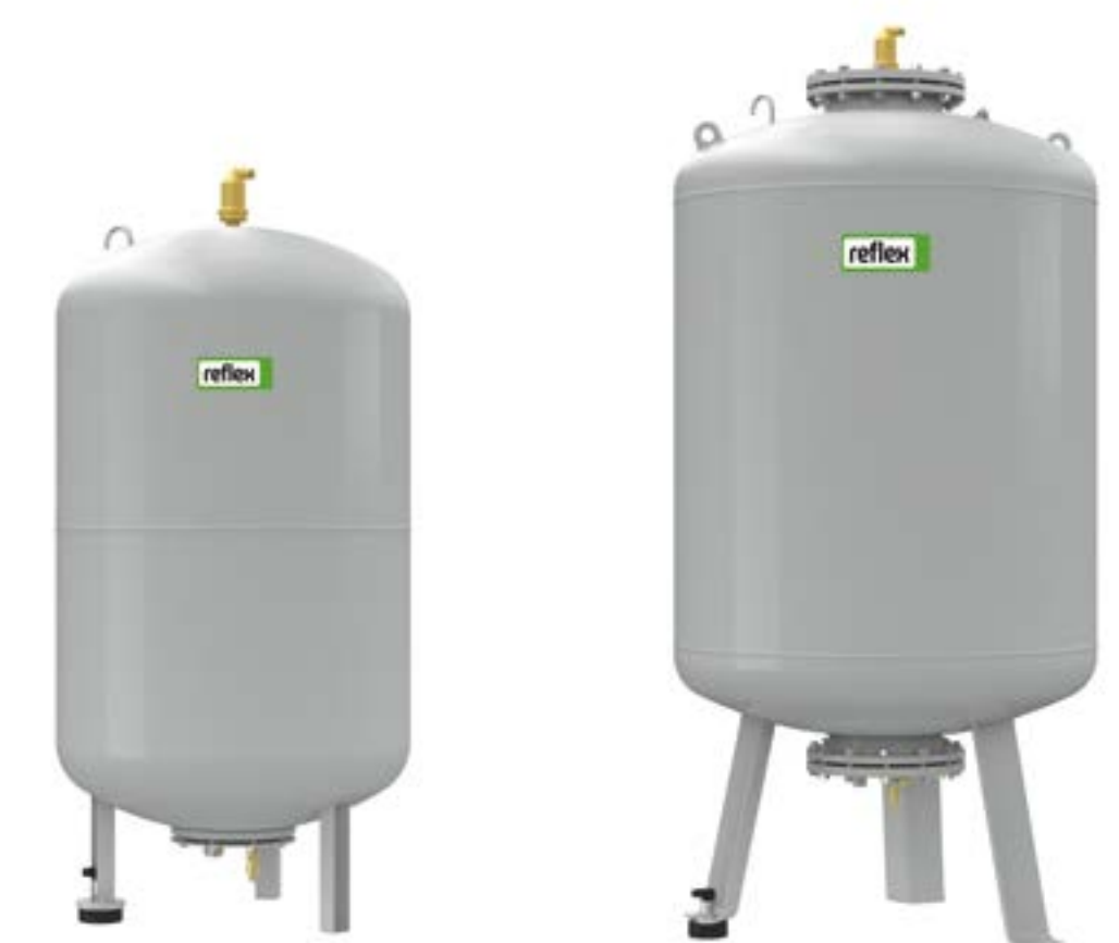
VG 500 VG 1000

tauschbare Vollmembran nach DIN EN 13831