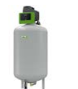
RS 90/1 Gefäßmontage