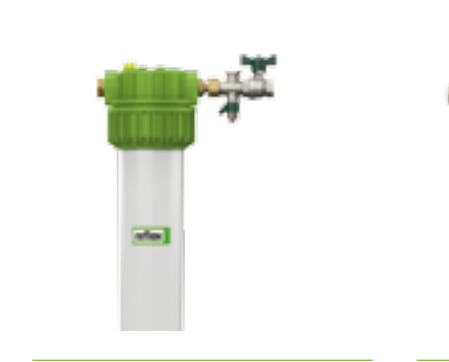
Fillsoft I Gehäuse