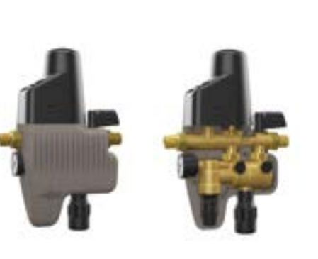
Fillcontrol Plus Compact