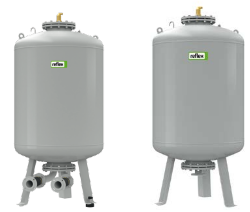
GG Grundgefäß GF Folgegefäß

tauschbare Vollmembran nach DIN EN 13831