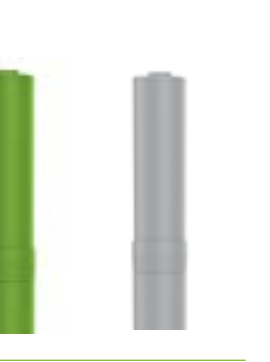
Fillsoft + Fillsoft Zero Patrone